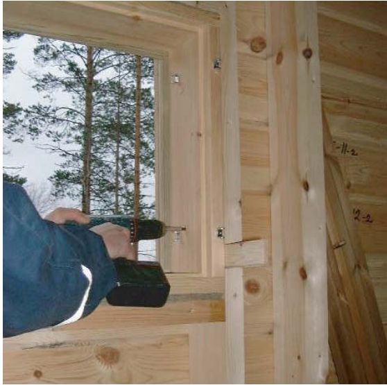
7. Kiinnitetään ikkunankarmi ruuveilla.