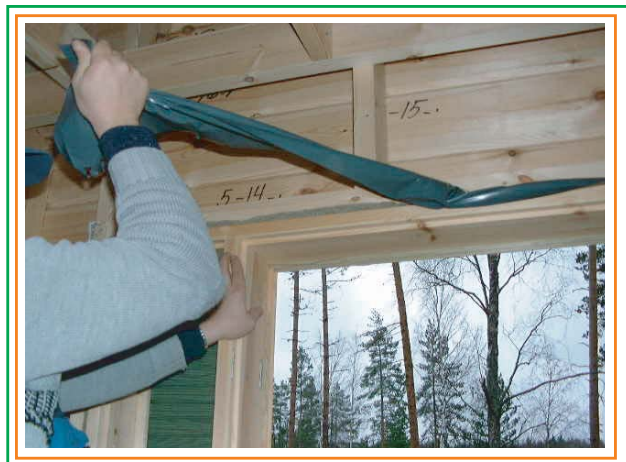
6. Poistetaan muovi.