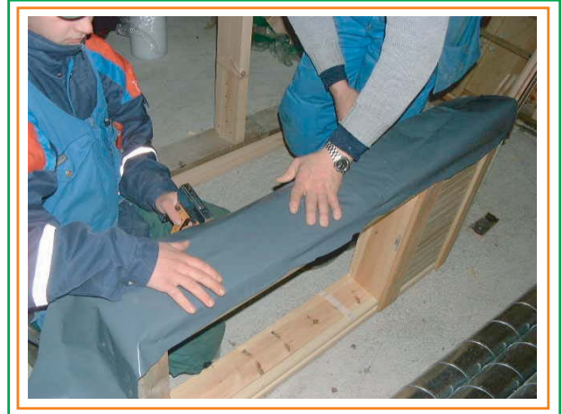
4. Kiristetään ISOLINA-pellavaeriste muovikaistan avulla. Nidotaan muovikaista karmin reunoihin.