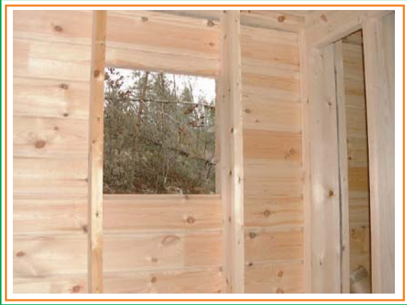
1. Tehdään ikkuna-aukko runkoon.