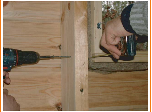
8. Pienet ikkunat ja tuuletusluukut voidaan kiinnittää ruuveilla rungon takapuolelta, jolloin säästytään ruuvinreikien tulppaamiselta.