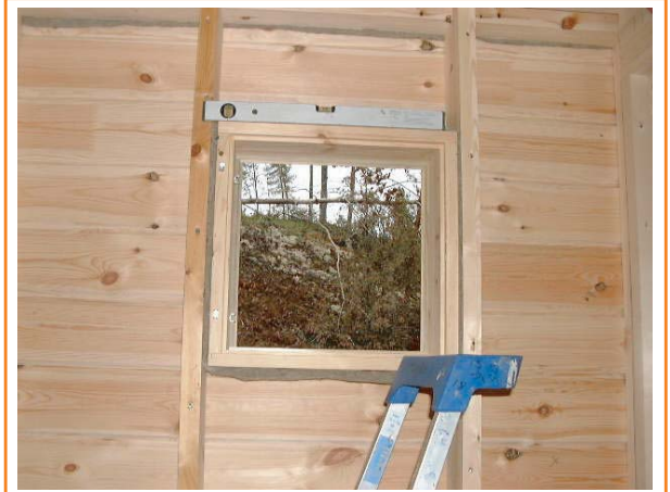
10. Kapeissa ikkuna-aukoissa aukon ylä- ja alapuu ei ole välttämätön.