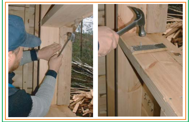
2. Asennetaan topparit ikkunalle ja rivevarat alapuun päälle.