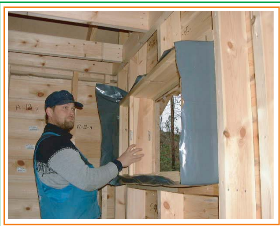
5. Asennetaan ikkuna paikoilleen.