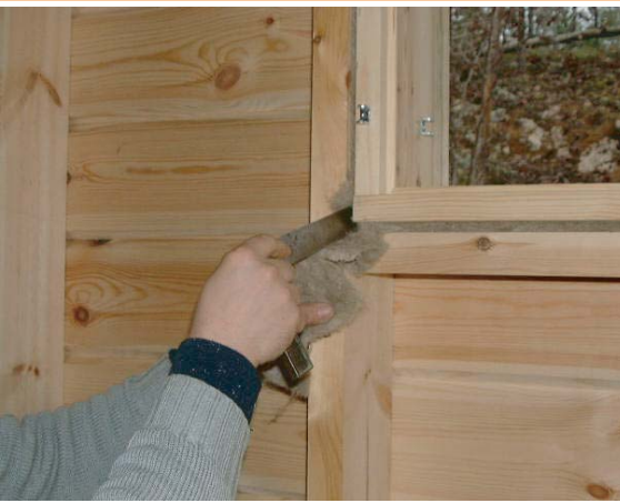
9. Tarkistetaan riveys ikkunan kulmissa.